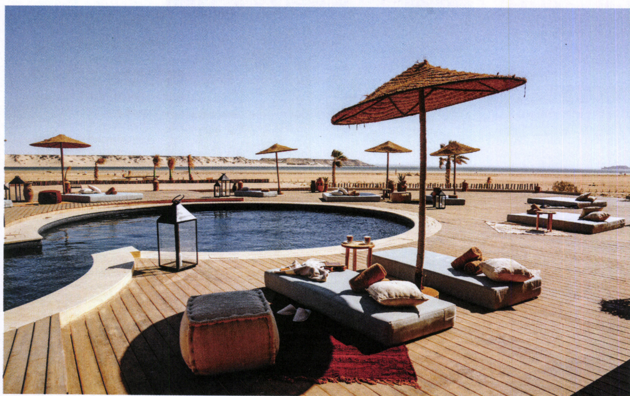
SOLE, VENTO E LE ACQUE DI DAKHLA LAGOON: SONO I PUNTI DI FORZA DI CARAVAN DAKHLA (DELLA CATENA HABITAS) NEL DESERTO MAROCCHINO.